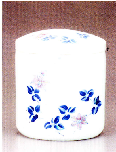
鉄線花 7寸 ¥36,000-