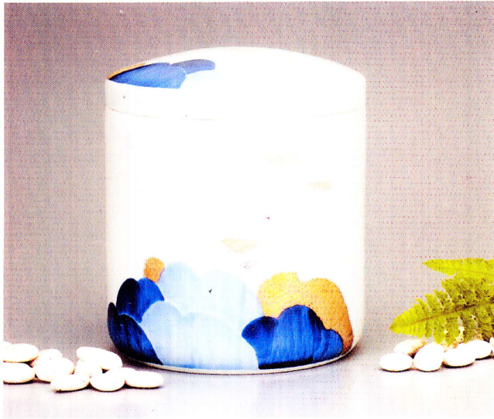
山の風景 (やまのふうけい) 7寸 ¥39,600-

伝統工芸品にも指定されている「瀬戸染付」 染付作家が一つ一つ手描きで仕上げております