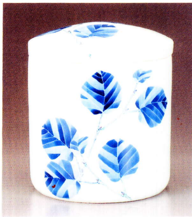
木の葉 (このは) 7寸 ¥36,000-