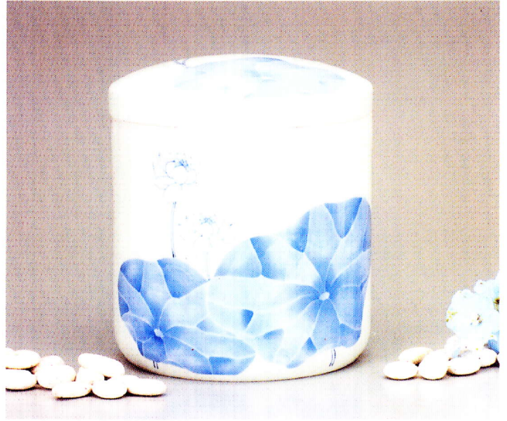
蓮 (はす) 7寸 ¥36,000-