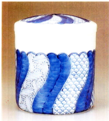
祥瑞 (しよんらい) 7寸 ¥83,000-